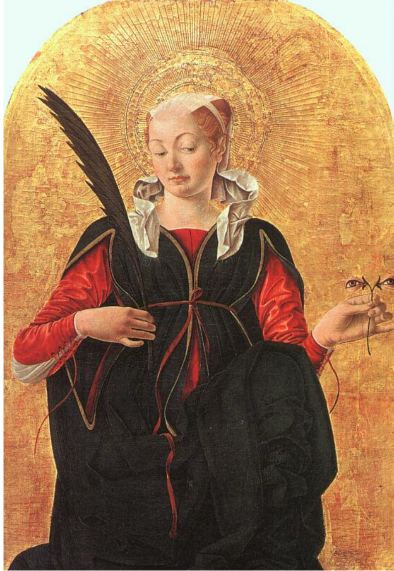
فرانشسكو دل كوسا Francesco del Cossa